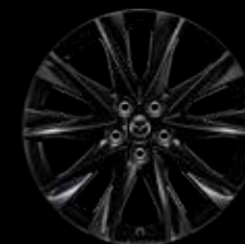
19" Lichtmetalen velgen design 68B