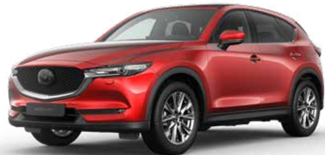
SOUL RED CRYSTAL METALLIC