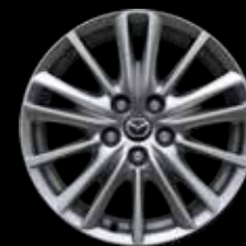
17" Lichtmetalen velgen design 161