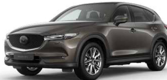
TITANIUM FLASH MICA