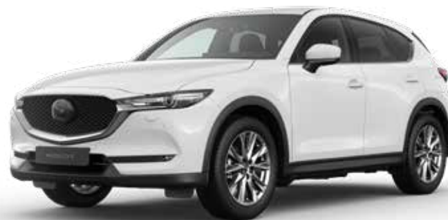
ARCTIC WHITE SOLID

De Mazda CX-5 is een ruime SUV die de toon zet op het gebied van design en rijeigenschappen. De hoge instap, de hoge trekkracht en het hoge afwerkingsniveau maken de verwachtingen meer dan waar. De Mazda CX-5 is geschikt voor vijf personen en hun bagage. Er is verder voldoende trekkracht voorhanden, ongeacht de uitvoering. En door de hoge zit is het zicht rondom uitstekend.