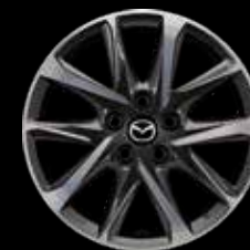
17" Lichtmetalen velgen design 67A