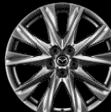
19" Lichtmetalen velgen Chrome Shadow, design 68