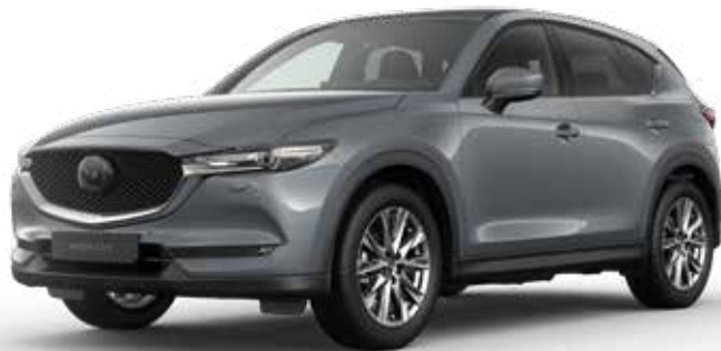
POLYMETAL GRAY METALLIC

Je hebt de keuze uit tien kleuren. Arctic White Solid vormt de basis. Machine Gray Metallic en Soul Red Crystal Metallic zijn het meest exclusief. Een speciale laktechniek met nog kleinere en heldere aluminiumdeeltjes zorgt voor een ongekend diepe, heldere kleur.