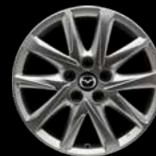
17" Lichtmetalen velgen design 67

Setprijzen incl. BTW, incl. TPMS-sensoren, excl. banden. Bandenprijzen kun je opvragen bij je Mazda-dealer.