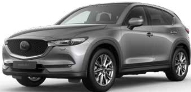
MACHINE GRAY METALLIC