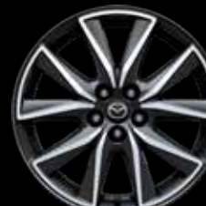
19" Lichtmetalen velgen design 162