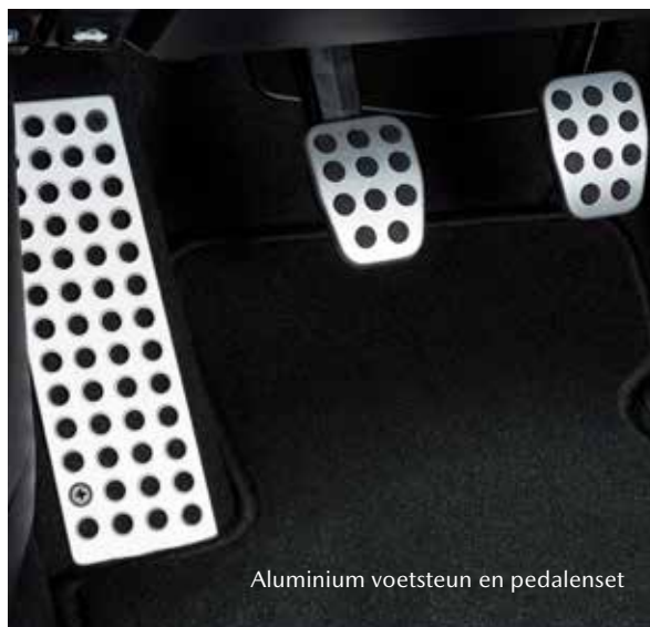
Aluminium voetsteun en pedalenset

Je hebt nu de kleur, de motor én de uitrusting van jouw Mazda CX-5 bepaald. Nu is het tijd voor de volgende stap. Voel je helemaal thuis in de Mazda CX-5 met onze dealeropties, speciaal voor de CX-5 gemaakt.