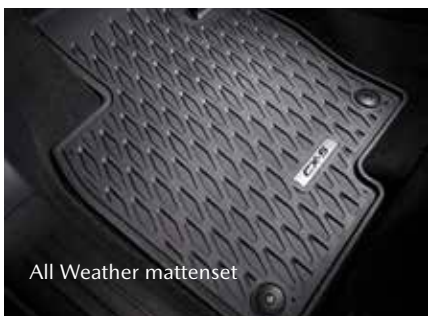
All Weather mattenset