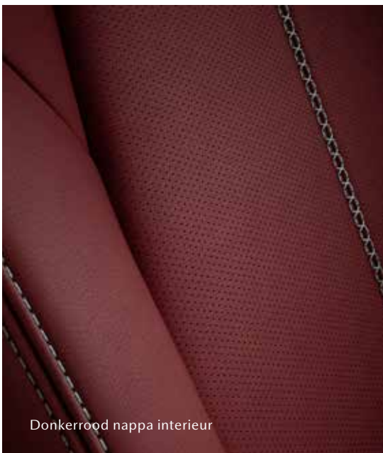
Donkerrood nappa interieur