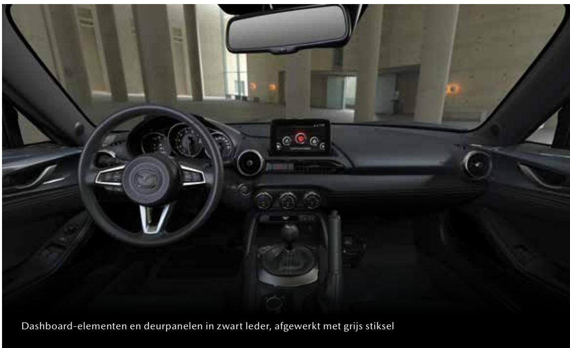
Dashboard-elementen en deurpanelen in zwart leder, afgewerkt met grijs stiksel