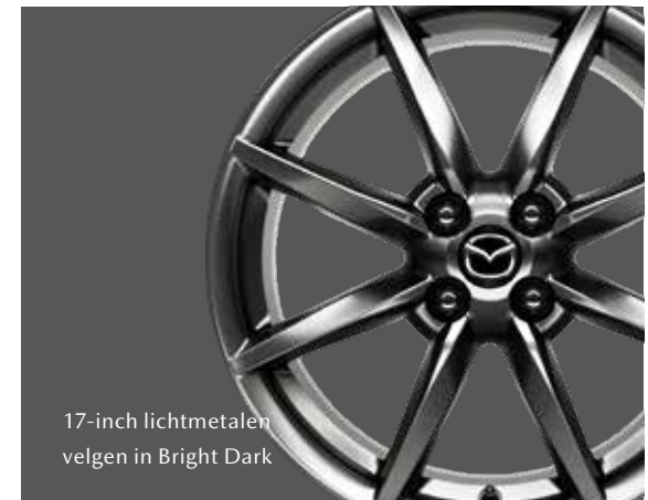
17-inch lichtmetalen velgen in Bright Dark