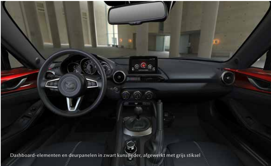
Dashboard-elementen en deurpanelen in zwart kunstleder, afgewerkt met grijs stiksel