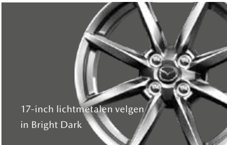
17-inch lichtmetalen velgen in Bright Dark