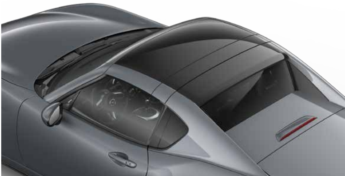
Mazda MX-5 RF Sportive in Polymetal Gray met Twin Tone dak