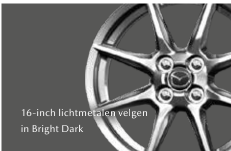
16-inch lichtmetalen velgen in Bright Dark