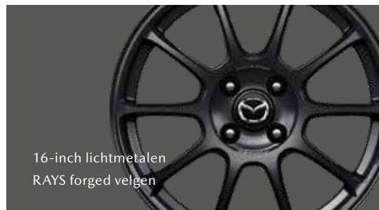
16-inch lichtmetalen RAYS forged velgen