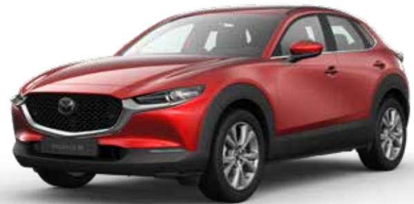
SOUL RED CRYSTAL METALLIC € 1.150