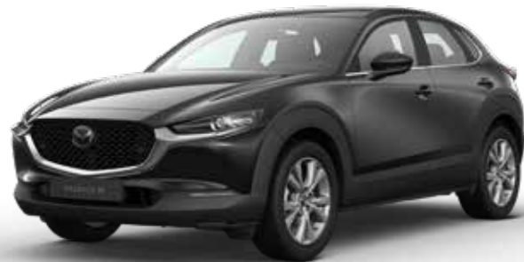
JET BLACK MICA € 800