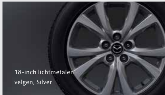
18-inch lichtmetalen velgen, Silver