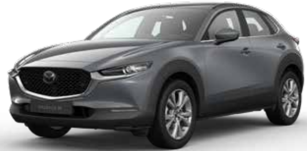
POLYMETAL GRAY METALLIC € 800