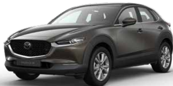
TITANIUM FLASH MICA € 800