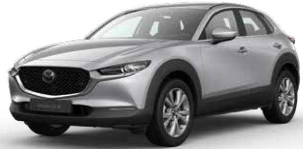
SONIC SILVER METALLIC € 800