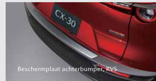
Beschermplaat achterbumper, RVS