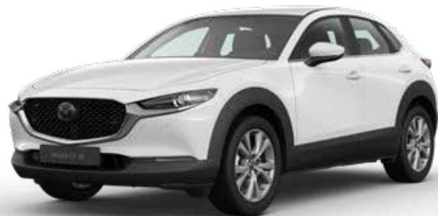
ARCTIC WHITE SOLID

Je hebt keuze uit negen kleuren. Arctic White Solid vormt de basis. Machine Gray Metallic en Soul Red Crystal Metallic zijn het meest exclusief. Een speciale laktechniek met nog kleinere en heldere aluminiumdeeltjes zorgt voor een ongekend diepe, heldere kleur.